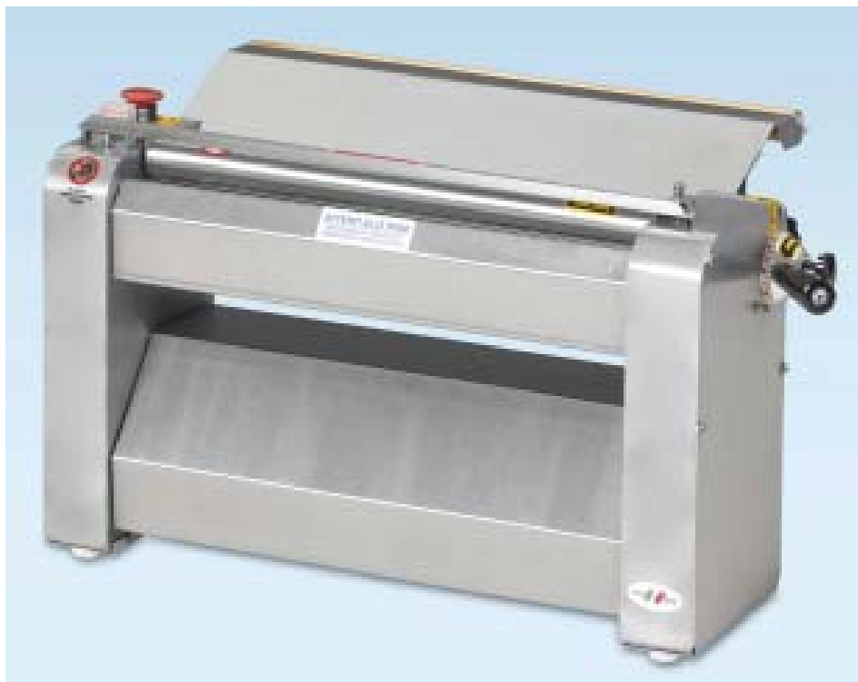
PIZZA ROLLER DOUGH ROLLER MACHINE